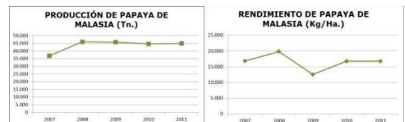
Ilustración 2. Indicadores de productividad en Malasia

Aunque Malasia se sitúa en la segunda posición como mayor exportador de papaya en el mundo, su nivel productivo es deficiente y carente de prospección. Su producción es estable al igual que su rendimiento por hectárea pero se observa que el volumen de las exportaciones muestra una tendencia decreciente.