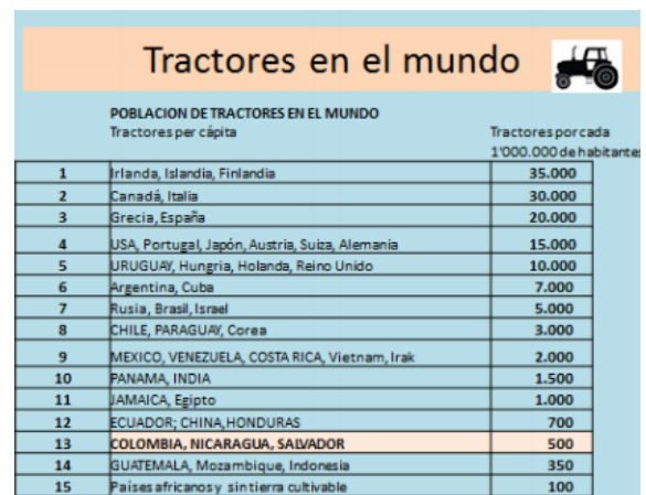
Ilustración 3 Tractores en el Mundo

Presenta un claro problema de competitividad internacional; se destaca su alta dispersión provocado en parte, por la dificultad al acceso y tenencia de la tierra junto a una infraestructura inadecuada que entorpece la logística de ésta, así como la baja implementación de paquetes tecnológicos y el difícil acceso a insumos básicos en todo el país, también la reducida capacidad financiera con la que cuentan los pequeños agricultores que exacerba los problemas para acceder al crédito por no cumplir con las condiciones establecidas y no poder pagar su elevado costo.