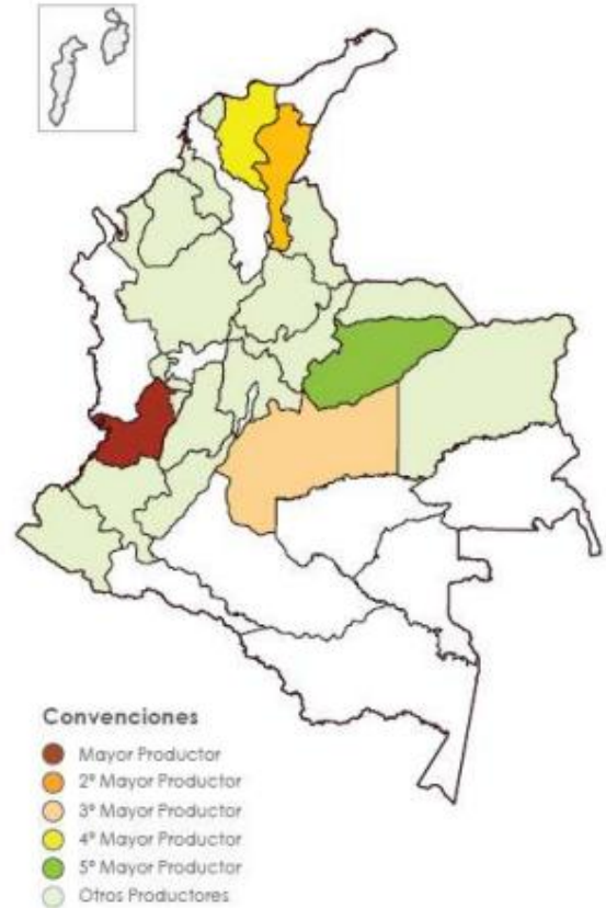
Ilustración 5. Mayores Departamentos productores de papaya en Colombia

concentra más de un tercio de la producción total de papaya en Colombia. De Segunda está Cesar con el 15.9% de participación.