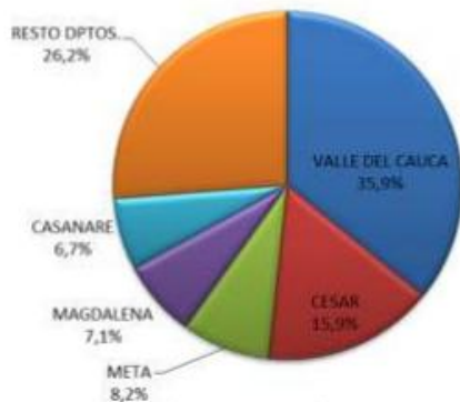
Ilustración 4 Distribución Departamental de la producción de papaya