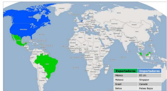
Ilustración 1. Mayores exportadores e importadores de papaya en el mundo

La producción de papaya en Colombia no ha sido significativa frente al mercado mundial donde México, Malasia y Brasil son los mayores exportadores de este bien.