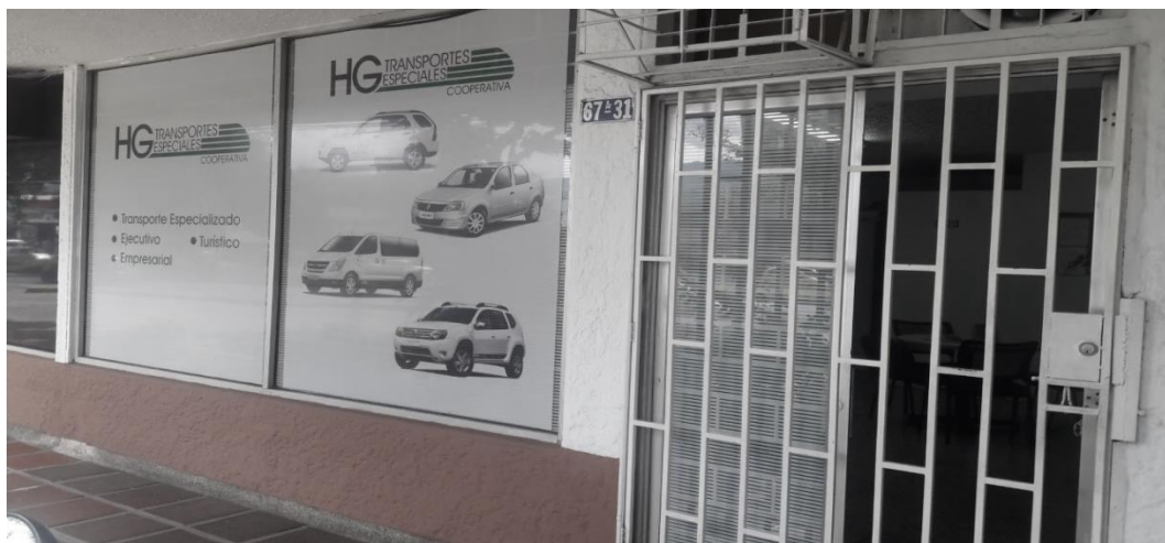
Imagen 1. HG Cooperativa de Transportes