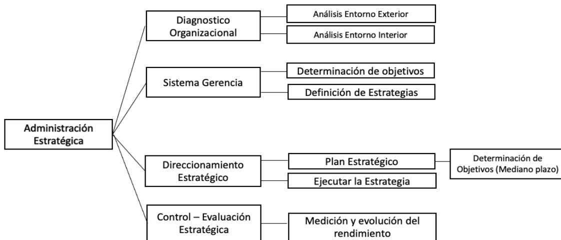
Figura 2. Elementos de la Gerencia Estratégica

Fuente: Elaboración a partir de Salas, Ortiz, y González (2018).