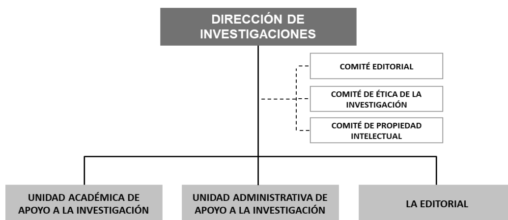
Esquema 1. Dirección de Investigaciones

Para el logro de una oportuna y eficiente gestión de investigación UNICATÓLICA cuenta con los siguientes órganos y dependencias. (Ver esquema 1).