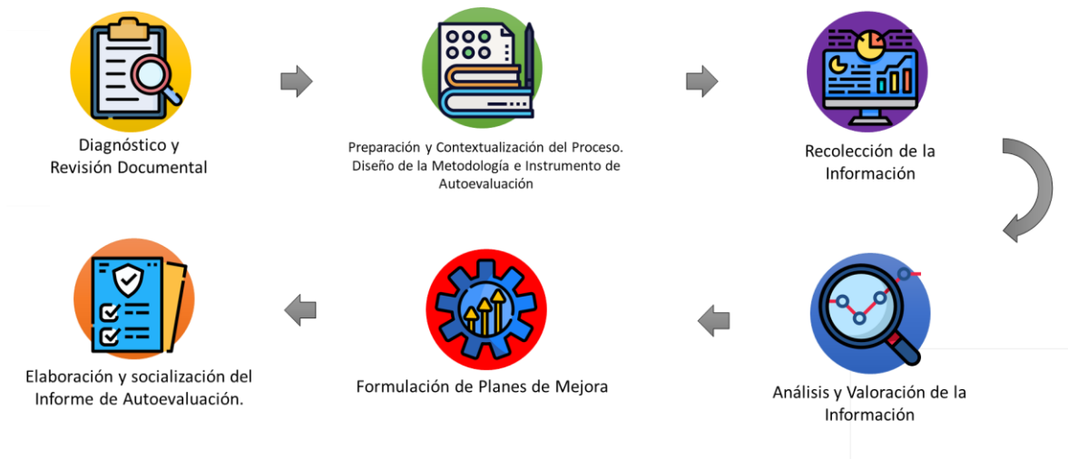
Esquema No. 3 Proceso del Modelo de Autoevaluación Institucional

“Por el cual se define la POLÍTICA AUTOEVALUACIÓN Y ASEGURAMIENTO DE LA CALIDAD INSTITUCIONAL de la FUNDACIÓN UNIVERSITARIA CATÓLICA LUMEN GENTIUM - UNICATOLICA”