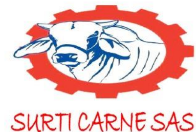
Tabla 1 Logo