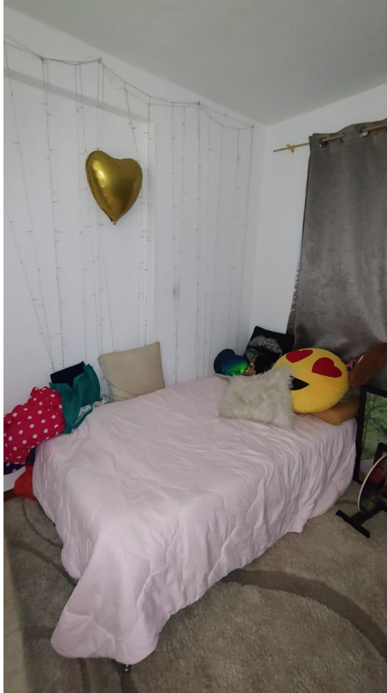
Ilustración 1. Espacio laboral de Isabel