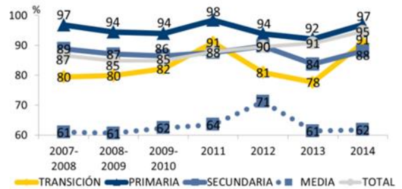
Tabla 1. Tasa de cobertura bruta en educación 2007-2014.

Fuente: Cámara y comercio de Cali.(2014). Informe de calidad de vida en Cali 2014. Recuperado de: http://media.wix.com/ugd/ba6905_906136a6aaca4cc59e683051c8d7ceff.pdf