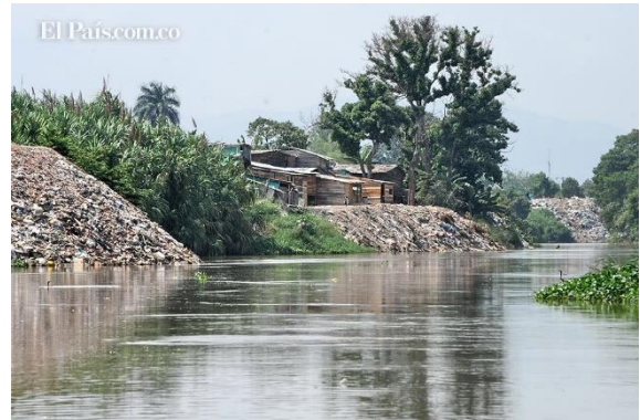
Ilustración 1. Jarillón del rio Cauca.