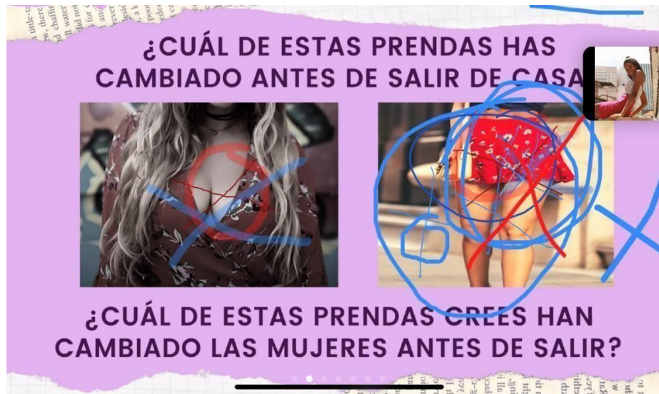
Figura 3. Grupo Focal 1 grupo mixto