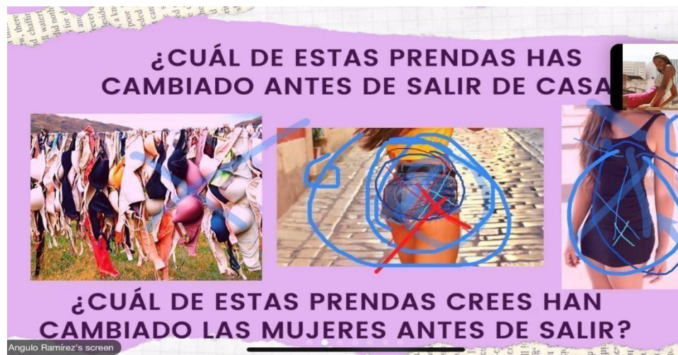
Figura 4. Grupo Focal 2 grupo mixto