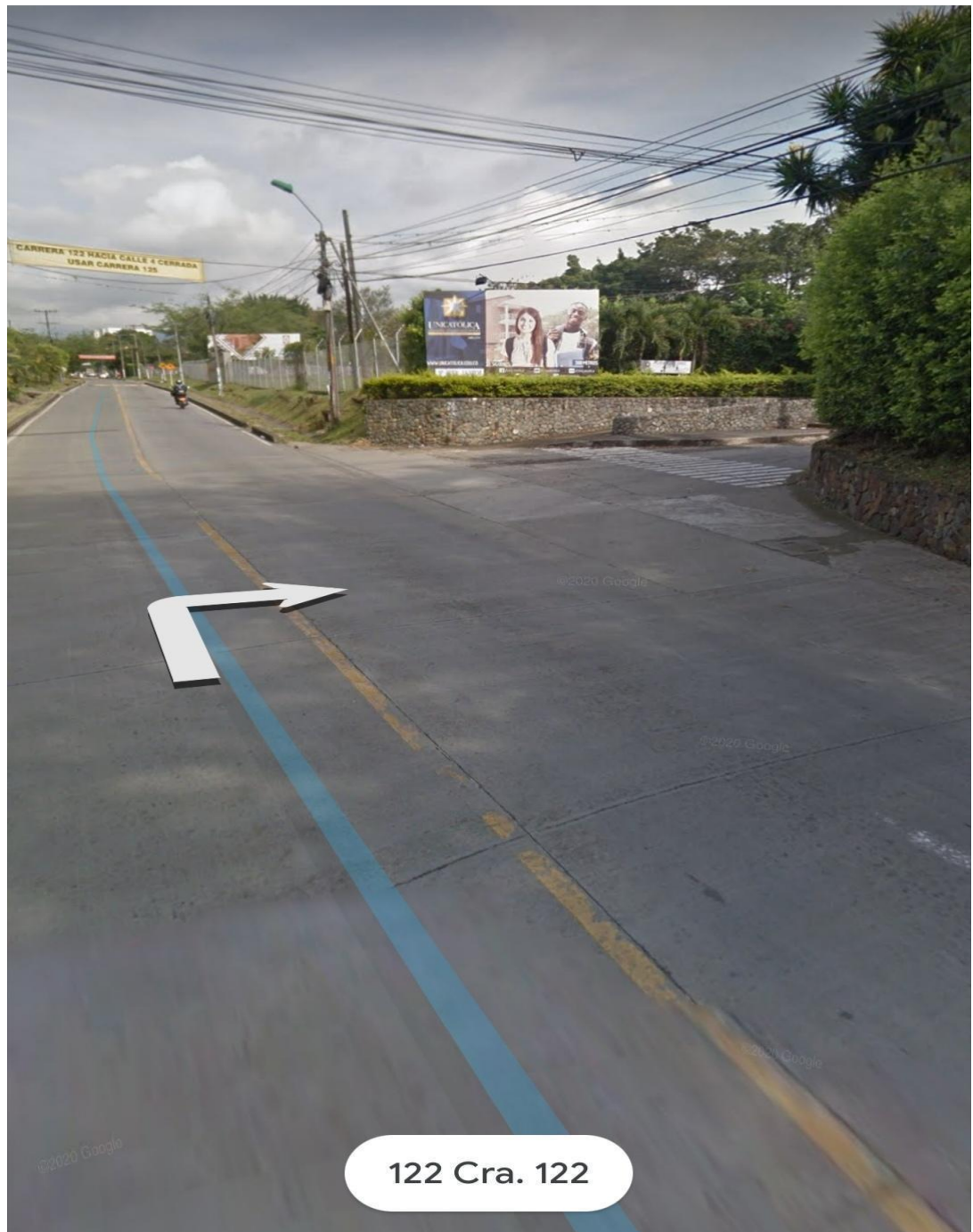
Imagen 2. Entrada hacia Unicatólica Pance. 2020