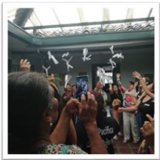
Ilustración 3. Técnica grupo focal Alicóptero

Una vez las participantes respondieron las preguntas, se ambientó con música de fondo, así también las actividades estuvieron mediadas por el juego facilitando un brote de emociones, conocimientos y sentires en relación a ¿qué significaba ser lideresas? Es allí, donde a partir de una actividad lúdica se generó momentos de goce, disfrute del entorno, además de la interacción con la otra, que permitió construir y deconstruir de manera colectiva las reflexiones, haciendo énfasis en plantear soluciones a las