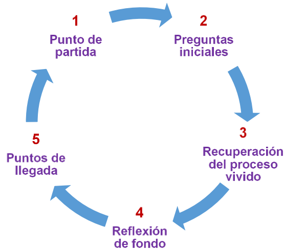
Figura 3. 5 tiempos metodológicos

A continuación, se presenta los tiempos de la sistematización de experiencia y se hace énfasis en cómo se vivió cada uno de ellos.