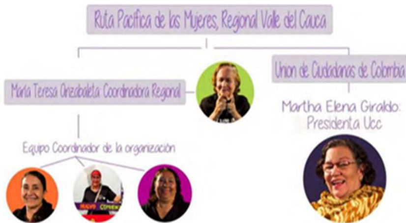
Figura 1. Organigrama junta de ruta pacífica de las mujeres Regional Valle del Cauca