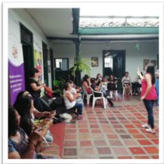
Ilustración 4. Técnica Grupo Focal La historia

Enseguida, las participantes expresaron la pertinencia del encuentro argumentando que requerían nuevas propuestas y estrategias, para continuar empoderando el proceso Trenzando Saberes y Poderes . Así pues, se logró evidenciar desde las voces de las participantes acerca de la acogida del encuentro, ellas expresaron que, si se cumplió con las expectativas, persistían en continuar reflexionando sobre las actividades y temas que se abordaron. Para concluir es importante