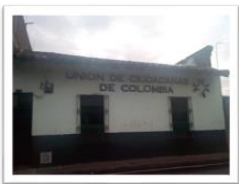
Ilustración 1. Fachada Ruta Pacífica

Cuando se habla de la “recuperación del proceso vivido” se hace referencia a la reconstrucción ordenada de lo que sucedió en la experiencia. Esto permitió tener una visión histórica de lo que pasó, de los principales hitos y de los acontecimientos acaecidos en el período de tiempo seleccionado. Además, en este momento se pretendió identificar el conjunto de aciertos y desaciertos generados durante la experiencia en aras de mejorarla; en otras palabras, este momento fue fundamental para la generación de conocimiento crítico sobre la práctica y para lograr advertir, en el caso de la presente SE, elementos claves del proceso de construcción de las lideresas como sujetas políticas.