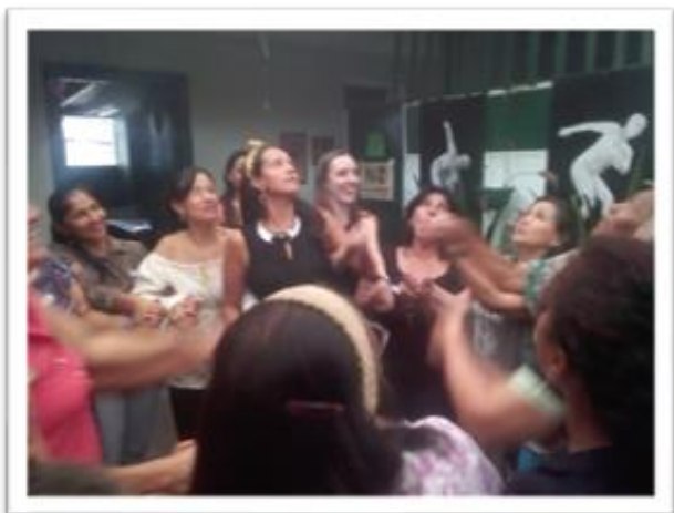
Ilustración 2. Técnica grupo focal si las motivaciones volaran

Pasando a la primera actividad lúdica, cabe resaltar que ese fue el momento, donde se observó al grupo con una mayor conexión con el encuentro. Es así, como antes de realizar esta maniobra las mujeres realizaron un relato alusivo al huevo, en el cual tuvieron que relacionar sus motivaciones frente al proceso de formación; a su vez convencer al público que su artefacto era el mejor en proteger